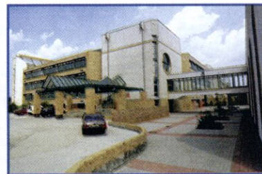
Uniwersytet im. A. Mickiewicza w Poznaniu

„JEDYNKA POZNAŃ” S.A. GRUPA KAPITAŁOWA EXBUD