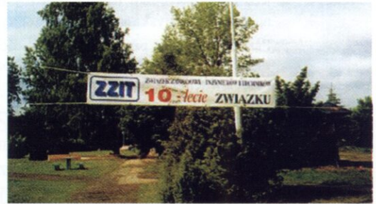
W dziesiątą rocznicę powstania Związku Zawodowego Inżynierów i Techników - twórcy i działacze Związku spotkali się w Mrągowie.