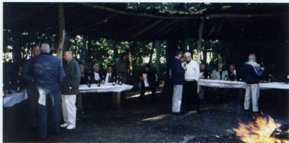
Przy ognisku śpiewaliśmy znane piosenki biesiadne z młodych lat.