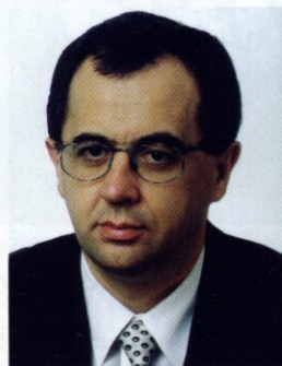
Sylwetki absolwentów PP

stwarza rynek kapitałowy. W celu przyspieszenia działań inwestycyjnych w mieście - par-