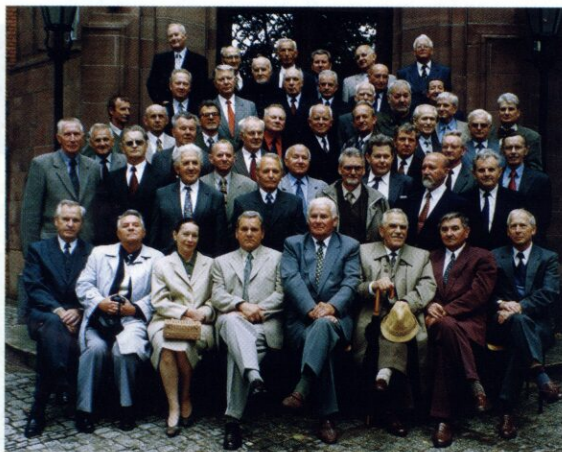
ZJAZD ABSOLWENTÓW WYDZIAŁU BUDOWY MASZYN Z 1961 ROKU

Aby o tym wszystkim wspominać, pojechaliśmy do Domu Pracy Twórczej i Wypoczynku UAM w Obrzycku. Na skraju Puszczy Noteckiej, w pałacu Raczyńskich, w zaciszu otaczającego go